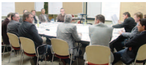
Delavnica v Alpsee-Grünten

so samo pogojno razumljivi, saj ravno skupni menedžment za gospodarski razvoj območja vključuje čim bolj ciljno usmerjen razvoj na regionalnem nivoju, torej s prihranki na času, stroških in na uporabi območnih virov.