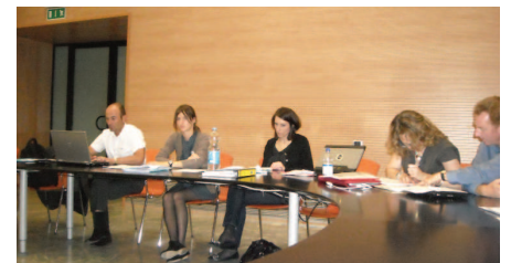
Projektno srečanje

Projektna skupina se je nato osredotočila na razširjanje znanja ter ocenila delo in strategije, ki stremijo k zagotovitvi trajnostnih projektov. Prvi delovni dan se je zaključil s predstavitvijo projektnega promocijskega gradiva, razpravo o zaključni konferenci in izmenjavo mnenj o vsebini in tehničnih vidikih dveh publikacij: Project Synthesis Booklet in Popular Scientific Final Publication, ki bosta izdani v prvi polovici leta 2012.