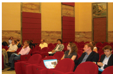
Konferenčna dvorana

lokacij (CLD). Skupina je intenzivno razpravljala o strukturi priročnika o smernicah za razvoj medobčinskih poslovnih lokacij (CLD) in poskušala na novo opredeliti in posredovati pisne prispevke med partnerji.