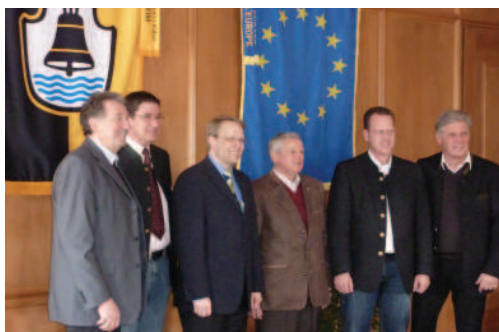
Župan regije Alpsee-Grünten

Potem ko so bili mestni ter občinski svetniki na skupnem informativnem sestanku obveščeni o načrtovani interesni skupnosti, je bilo sprejemanje sklepov s strani mestnih in občinskih svetnikov o sestavi osnutka statuta naslednji predvideni korak k razvoju skupnega menedžmenta gospodarskih površin v regiji Alpsee-Grünten. Mesto Immenstadt pa je z osmimi glasovi za ter štirinajstimi proti zavrnilo načrtovani skupni menedžment gospodarskih površin. Razlogi za to odločitev mestnega sveta Immenstadt so bili med drugim »optimalna« izraba površinskih potencialov pri prenosu kompetenc ter v povezavi z nezaupanjem v skupno interesno skupnost. Ti izraženi pomisleki