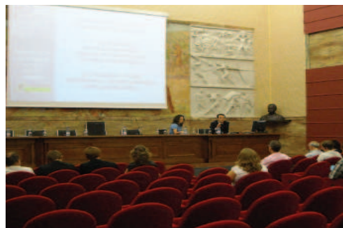
Konferenčna dvorana na zbornici za trgovino

27. in 28. julija, je lokalna razvojna agencija Langhe Monferrato Roero (LAMORO) v kraju Asti v Italiji gostila peto čezmejno projektno srečanje. Na zbornico za trgovino, industrijo, obrt in kmetijstvo so bili partnerji v projektu povabljeni k poslušanju o napredku, prvih rezultatih in naslednjih korakih testnega projekta agencije LAMORO ter k izmenjavi izkušenj s svojimi lastnimi testnimi projekti.