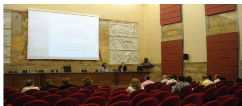
Les partenaires du projet

La Faculté d'Economie de l'Université d'Asti a présenté l'analyse effectuée dans les zones industrielles de Nizza Monferrato, Canelli et Calamandrana (trois municipalités de la province d'Asti). Ensuite, des experts de la municipalité de Moncalieri (Province de Turin) ont exposé l'expérience de leur territoire et la stratégie mise en œuvre pour développer une zone d'activité économique mixte dans la zone industrielle de Vadò, par le biais d'un consortium d'entreprises.