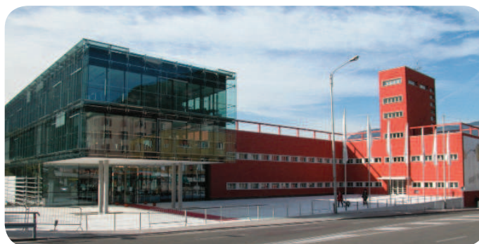
Académie Européenne de Bolzano

Les résultats atteints dans le cadre du projet seront présentés à l'occasion de la Conférence finale qui aura lieu les 8 et 9 mars 2012 à l'Académie européenne de Bolzano (Italie).