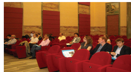
Les partenaires du projet

L'équipe de travail du projet a ensuite soigneusement analysé la mise en œuvre du système de diffusion et de gestion du savoir, en évaluant le travail mené à terme jusqu'à présent et les stratégies envisagées pour assurer la durabilité du projet. La première journée de travail s'est terminée avec la présentation du matériel promotionnel du projet, avec un débat sur la conférence finale et un échange d'opinions sur le contenu et les aspects techniques des deux publications: une brochure de synthèse du projet et l'ouvrage final de vulgarisation scientifique, qui sera imprimé et publié dans la première moitié de 2012.