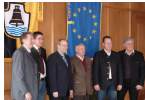
Les maires de la région Alpsee-Grünten

plutôt que la quantité, et seul un plan d'action efficacement partagé pourra préserver les emplois pendant longtemps dans la région.