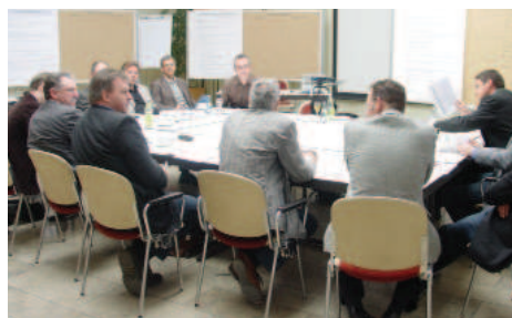
Workshop dans la région Alpsee-Grünten

A l'issue de la réunion d'information avec la participation des conseils municipaux du territoire, ayant pour objet la discussion du projet de création d'un consortium inter-municipal, les conseils municipaux ont décidé de préparer un document normatif préliminaire réglant à l'avenir le projet commun de développement de zones d'activité économique mixtes