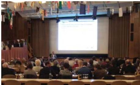
Informativen sestanek za občinske in mestne svete v regiji Alpsee-Grünten © Mesto Sonthofen, 2011.

občinami se ne zdi pomembno, na katerem mestu se ponudi novo delovno mesto; pomembno je, da bo zagotovljena in razvita „regionalna“ ponudba delovnih mest v regiji Alpsee-Grünten.