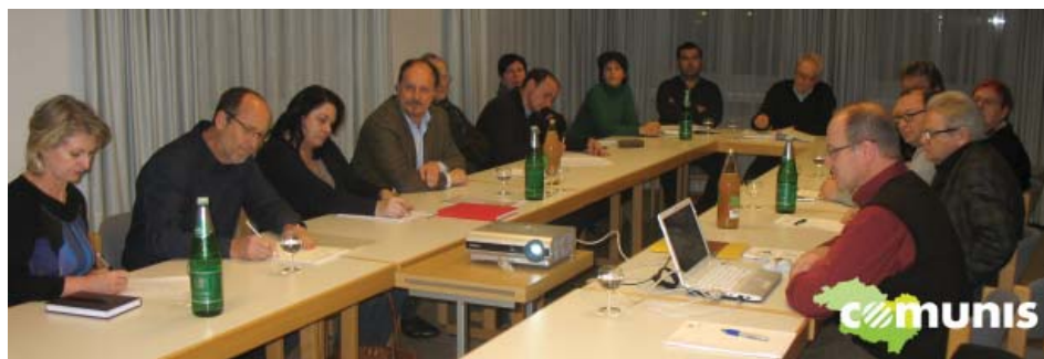
Srečanje delovnih skupin z vsemi župani 03.02.2011 v kraju Lochau