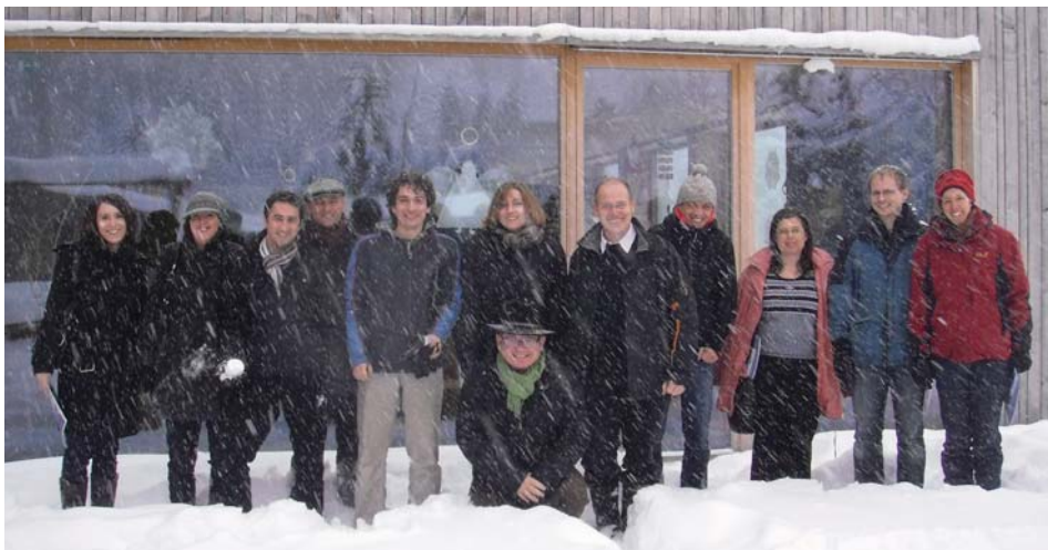
Projektne partnerje COMUNIS v zasneženem St. Geroldu.

predvsem za manjše skupnosti sodelovanje izjemno pomembno, saj tako skupaj poskrbijo za delovanje potrebnih javnih služb. Projekt COMUNIS je za Großwalsertal pomemben, saj ustvarja strukturo, ki zagotavlja in bodo zagotavljale privlačne pogoje za manjša in srednje velika podjetja. Občinski center v Blonsu (Biosphere Park), četrtna skupnost občine Blons, spominsko