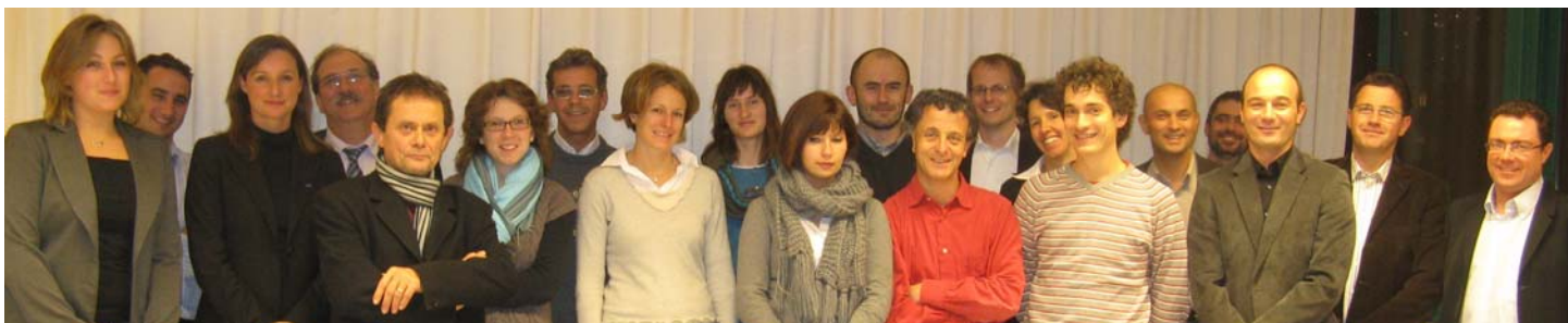
Réception officielle des partenaires du projet à la Communauté de communes du pays de Tarare © CCIL 2009.