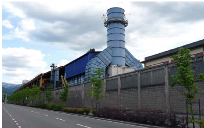
Slika 2: Industrijska cona v Bolzanu na južnem Tirolskem.

WP 7: Končno bodo dosežki Delovnih sklopov pet in šest načrtno analizirani. Skupna strategija za CLD bo modificirana skladno z oceno, s priporočili in z izkušnjami, ki se bodo tako pojavile. Hkrati bodo finalizirani okvirni pogoji za trajnostno upravljanje z znanjem.